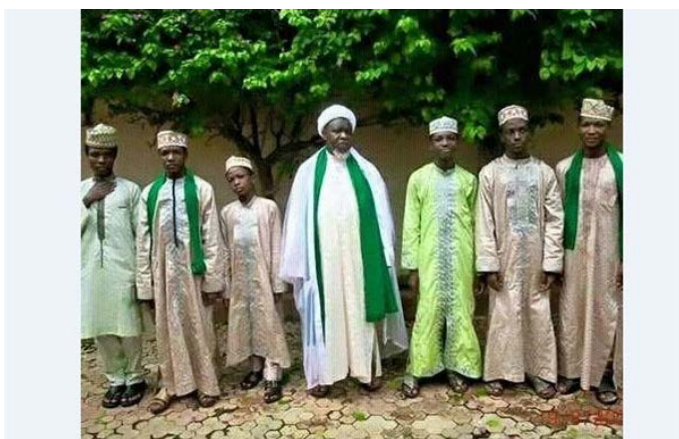
شیخ زکزاکی و ۶ پسر شهیدش