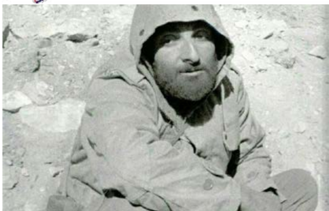
شهید باکری در اوج خستگی