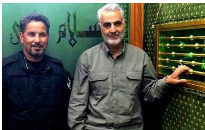
حاج قاسم سلیمانی در سامرا