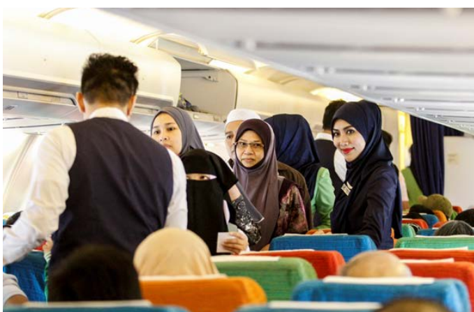
آغاز به کار نخستین ابرلاین شرعی در مالزی