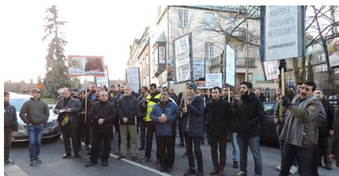
نظارات مردم سوئد در انتظار به جنایات در نیجریه