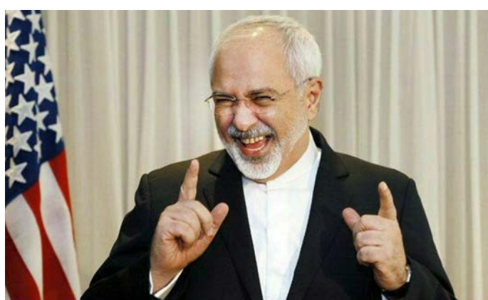
خنده محمد جواد ظریف یکی از ۳۵ خنده برتر دنیا در سال ۲۰۱۵ با نظرسنجی سی ان ان