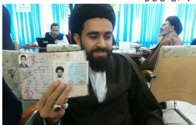
طلبه ۲۶ ساله جوانترین کاندیدای خبرگان