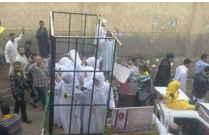
داعش و تبلیغ فروش زنان سنجاری