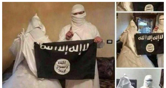
ازدواج یک زوج داعشی!