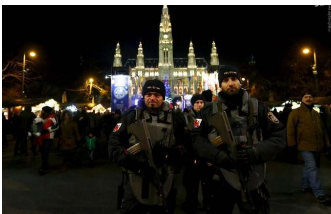
سایه وحشت داعش در جشن سال نو میلادی