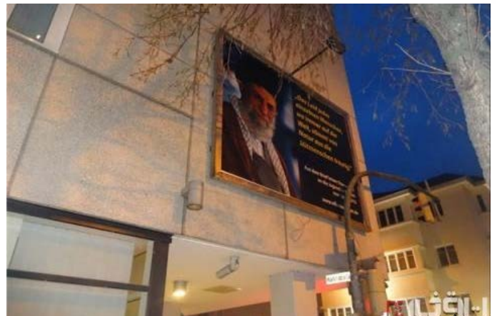
آلمان - نصب تابلوی حاوی بخشهایی از نامه دوم رهبر انقلاب به جوانان