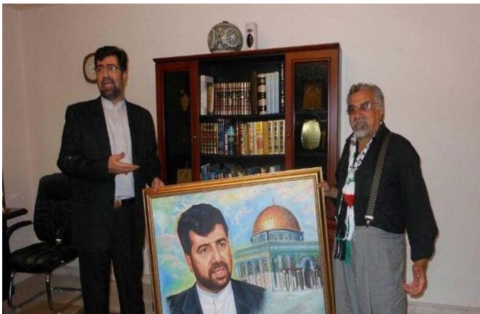
رکن آبادی: این عکس برای بعد از شهادت من خوب است!