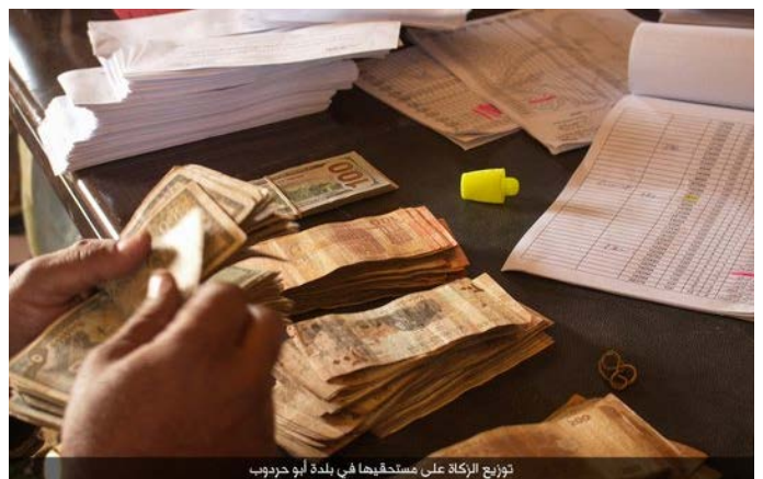
تصاویر دروغین از اعمال خیرخواهانه داعشی ها!