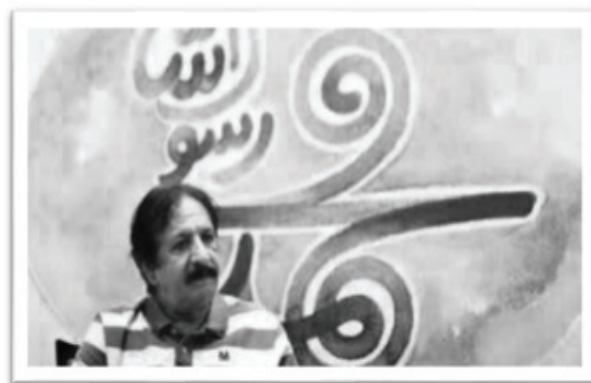
نمایش محمد رسول‌الله در ترکیه