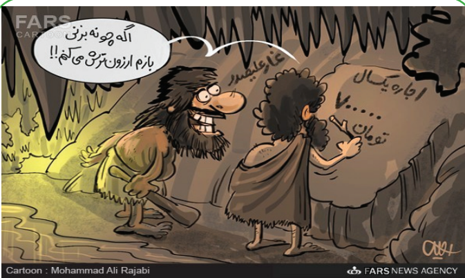
اجاره میراث ملی به سبک دوران غارتشینی!