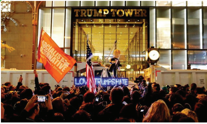
اعتراضات به نتایج انتخابات آمریکا