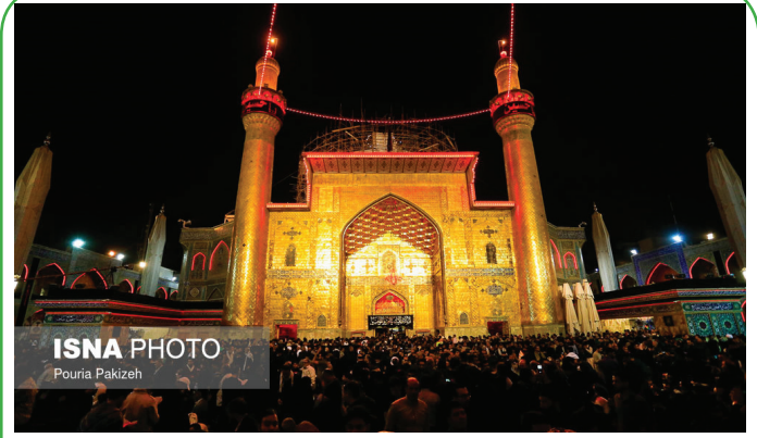
نجف - حرم حضرت علی (ع) در آستانه اربعین