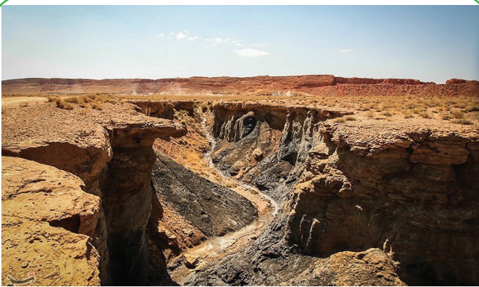
اصفهان - منطقه گردشگری تخته سرخ میمه