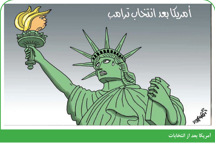
آمریکا بعد از انتخابات