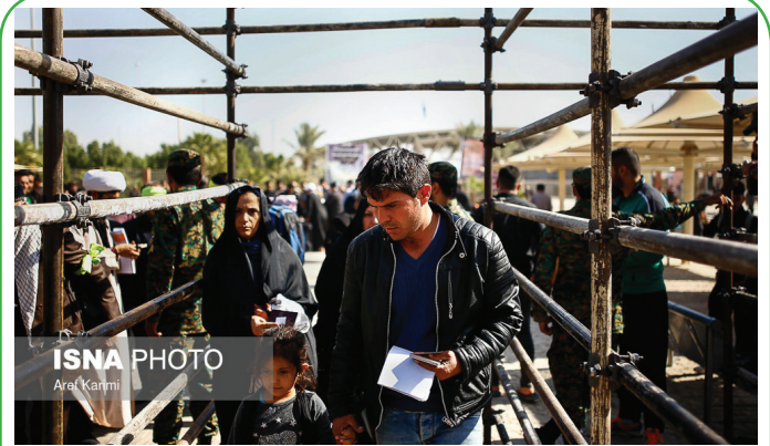
عزاداران اربعین در مرز مهرا