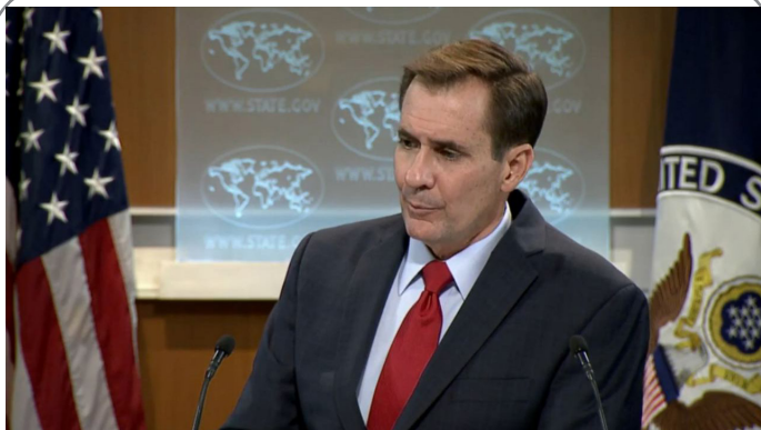
سخنگوی وزارت خارجه آمریکا: ممکن است روسیه هدف حمله تروریستی قرار گیرد!