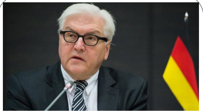
مخالفت حزب چپ‌گرای آلمان با وزیر خارجه این کشور درباره منطقه ممنوع پرواز در سوریه