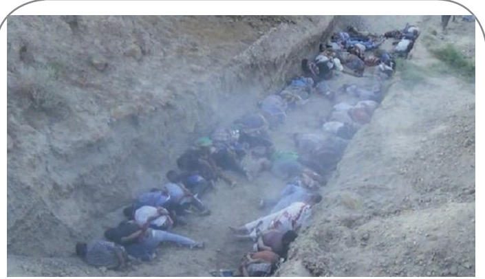
تصویری از جنایت در شهر الطارمیة عراق که داعش به تازگی آن را منتشر کرد