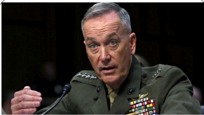
هشدار رئیس ستاد مشترک ارتش آمریکا درباره تبعات ایجاد منطقه پرواز ممنوع در سوریه