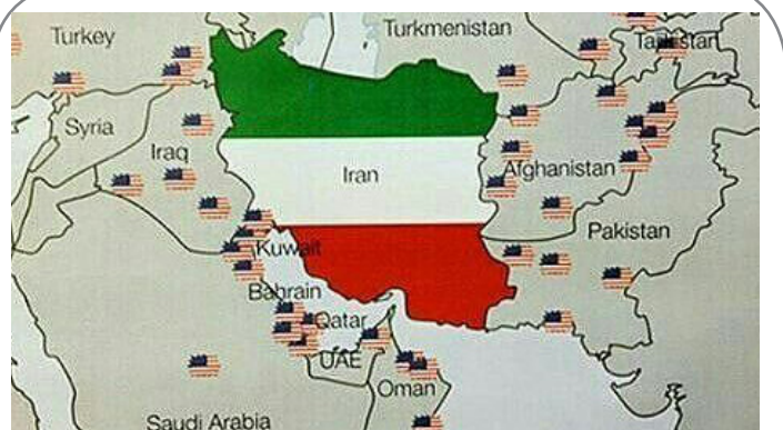
آمریکا هزاران کیلومتر خارج از مرز خود چه می خواهد؟