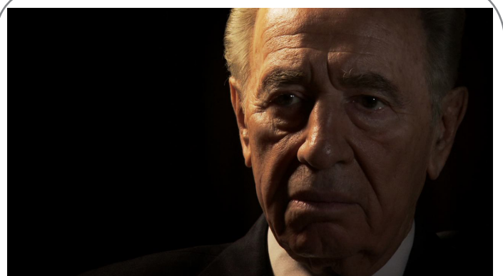
شیمون پرز معروف به «جلاد قانا» در سن ۹۳ سالگی مُرد