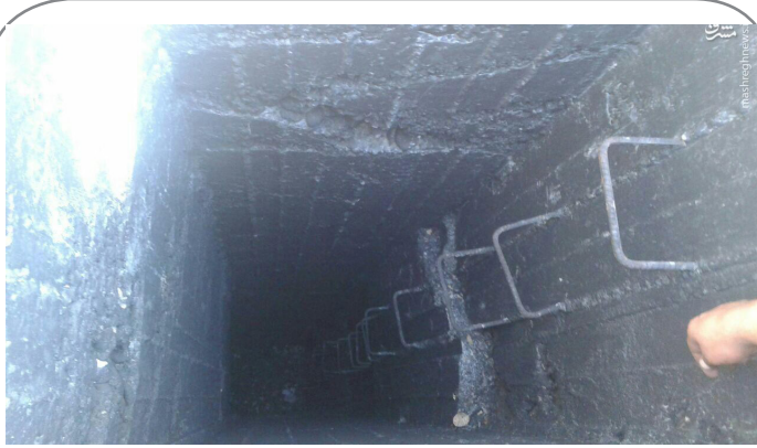
کشف شبکه تونل‌های داعش در منبج (شمال استان حلب سوریه و نزدیک مرز ترکیه)