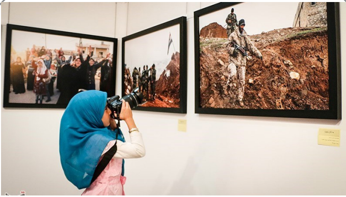
نمایشگاه عکس‌های حسین مرصادی با عنوان زیتون