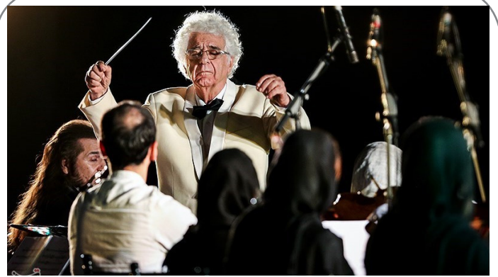
اجرای ارکستر زهی به رهبری لوریس چکناواریان در جشنواره بارانا