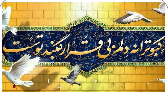
اکران «کیوترا نه دلم بی‌قرار گنبد توست» بر روی دیوار نگاره میدان ولیعصر (عج)