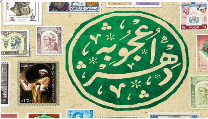
پوستر «عجوبه دهر» یادبودی برای ابن سینا و بزرگداشت روز پزشک