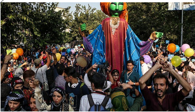
حضور عروسک‌ها در شانزدهمین جشنواره بین‌المللی نمایش عروسکی