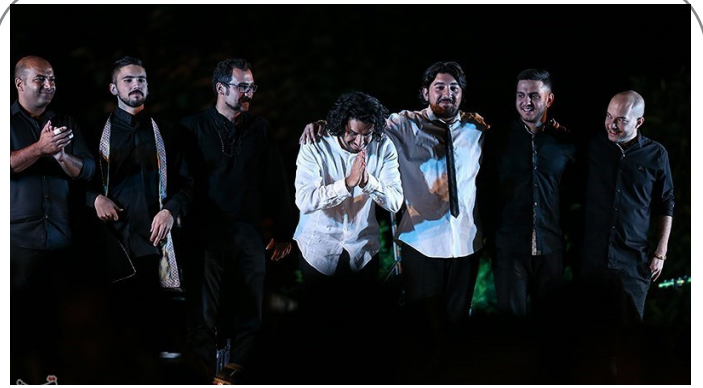
اجرای موسیقی سهراب پورناظری و آنتونیو ری