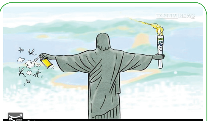
نگرانی از وجود ویروس زیکا در المپیک