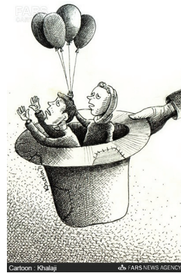
وجود ۷ هزار کودک کار در تهران