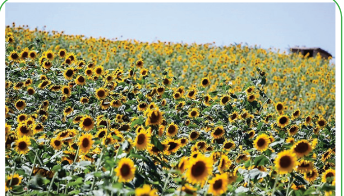
مزارع آفتابگردان در استان گلستان