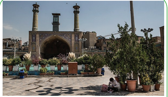
روز جهانی مسجد