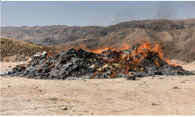
امحای بیش از ۳۳ میلیون نخ سیگار قاچاق در شیراز