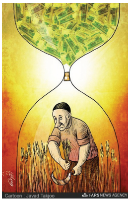
صدای بُردرد برنج کار : جیب‌های پُرپول دلالتان