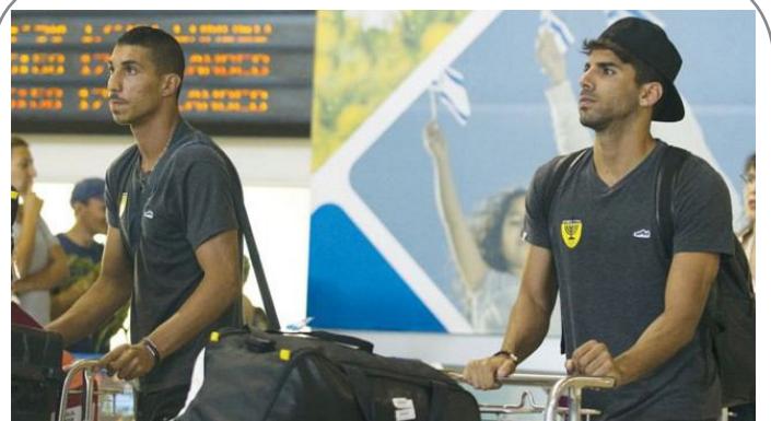
افزایش شمار توریست های صهیونیست در عربستان سعودی و سایر کشورهای عرب