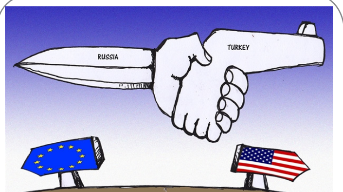
اتحاد روسیه و ترکیه!