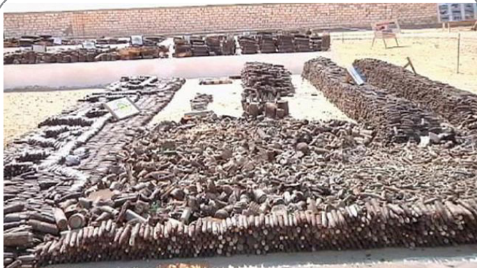
استفاده داعش از مین های به جا مانده نازی ها از جنگ جهانی دوم در مصر