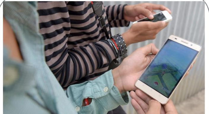
وزارت دفاع امریکا بازی «پوکمون گو» را به دلایل امنیتی ممنوع کرد