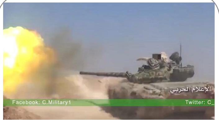
حضور تانک تی ۷۲ ارتش سوریه مجهز به سامانه اخلا لگر سراب ۱ در نبرد حلب