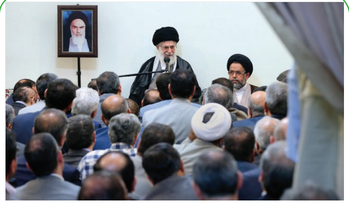
دیدار وزیر، معاونان و مدیران وزارت اطلاعات با رهبر انقلاب