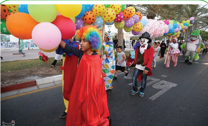
جشنواره تابستانی کیش