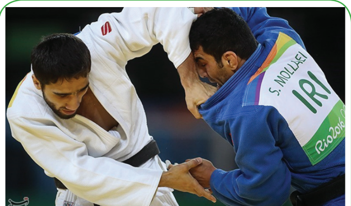
مسابقات جودو ریو ۲۰۱۶ - جودوکار ایرانی مقابل حریف