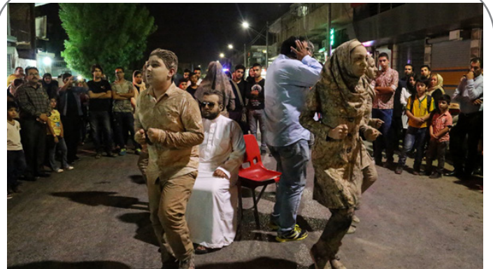
نمایش خیابانی آبادانی ها به کارگردانی رضا چوپان