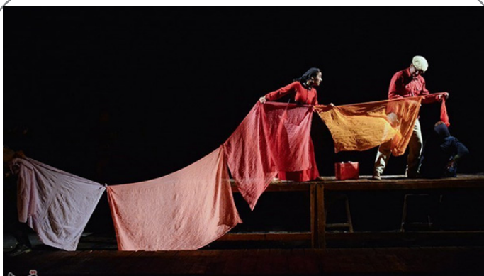
نمایش «مثل آب برای شکلات» به کارگردانی ابراهیم پشت کوهی - مجموعه ایرانشهر