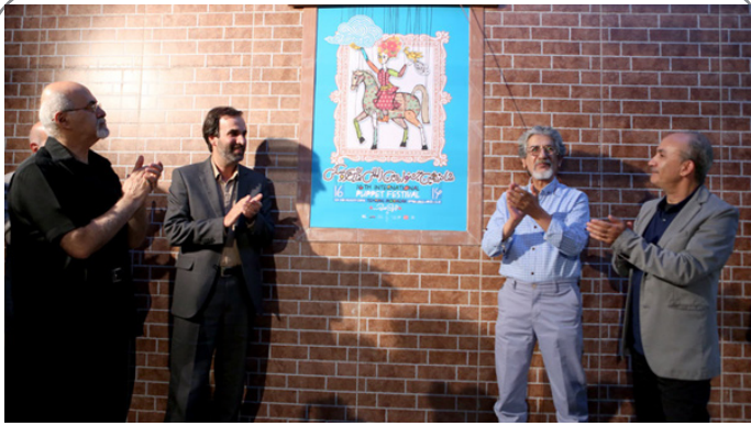
رونمایی از پوستر شانزدهمین جشنواره بین المللی نمایش عروسکی