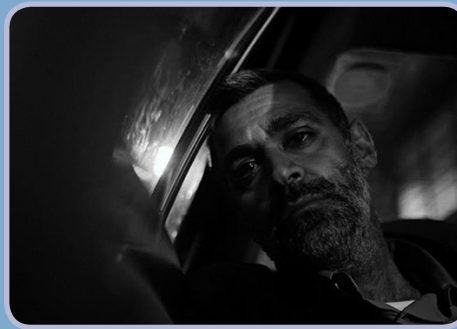
«طبل» در جشنواره ونیز