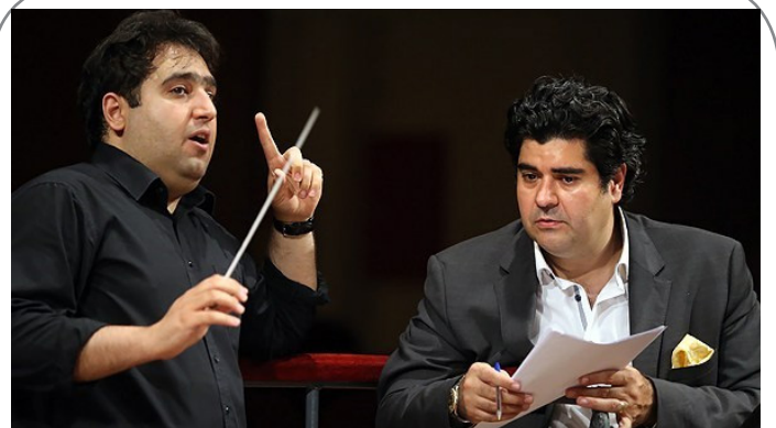
تمرین ارکستر ملل به خوانندگی سالار عقیلی