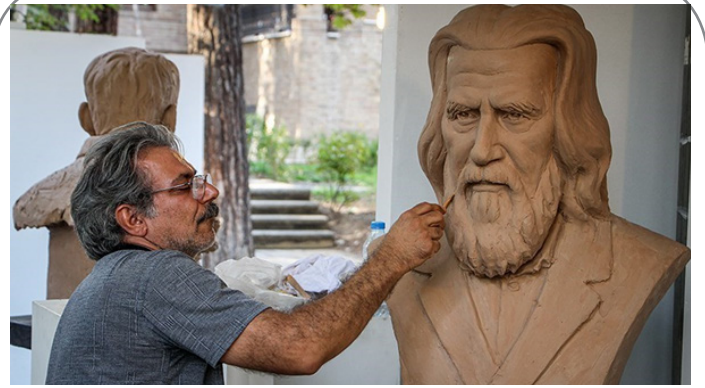
نخستین سمپوزیوم مجسمه سازی مفاخر ایران در تهران