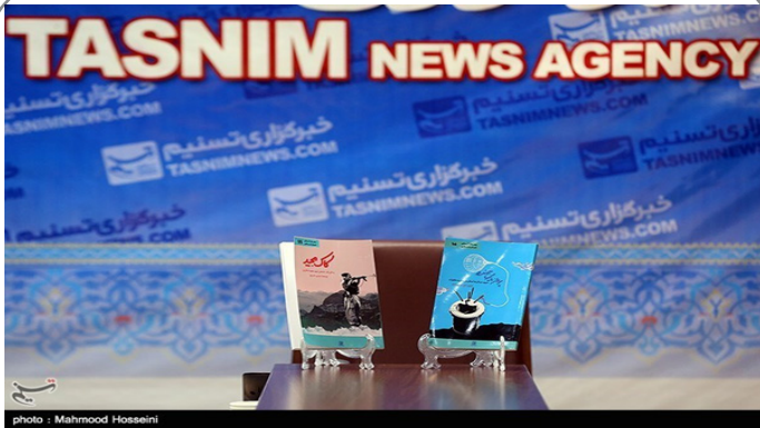
رونمایی از دو کتاب دفاع مقدس با عنوان پرواز با مین جهنده و کاک مجید