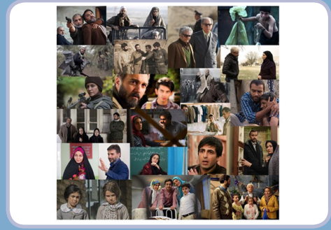
جشنواره بین‌المللی مقاومت

فیلم سینمایی «طبل» نخستین ساخته کیوان کریمی در نخستین نمایش بین‌المللی خود به نمایندگی از سینمای ایران در بخش رقابتی «هفته منتقدان» در هفتاد و سومین دوره جشنواره بین‌المللی فیلم «ونیز» در ایتالیا به نمایش در خواهد آمد و با فیلم‌هایی از کشورهای مختلف جهان برای تصاحب جایزه به رقابت می‌پردازد. این فیلم، ماجرای وکیلی را به تصویر می‌کشد که پس از دریافت بسته‌ای زندگی‌اش تحت تأثیر آن بسته، به کلی دگرگون می‌شود. «طبل» یک اثر اقتباسی از کتابی به همین نام، نوشته علی مراد فدایی‌نیا است.