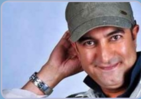
«پسر عمو و دختر عمو»

«لانتوری» با موضوع اسید پاشی یکی از کنجکاو برانگیز ترین فیلم‌های اکران است. تماشای آن برای افراد زیر ۱۶ سال ممنوع اعلام شده است. «دزد و پری» به کارگردانی حسین قناعت، «زاپاس» در ژانر کمدی و اجتماعی ساخته شده و برزو نیک نژاد آن را کارگردانی کرده است. «دراکولا» جدیدترین اثر رضا عطاران است. خلاصه داستان: (باصدای آهسته) الو... سلام قربان... خوبین... «بارکد» پنجمین فیلم بلند سینمایی مصطفی کیایی است. «رسوایی ۲» به کارگردانی مسعود دهنمکی در حال اکران است. «دختر» جدیدترین اثر رضا میرکریمی است. «عادت نمی‌کنیم» و «ایستاده در غبار» که زندگی حاج احمد متوسلیان، فرمانده جاویدالآثر لشکر محمد رسول الله (ص) را از دوران کودکی تا سال‌های حضور در جبهه‌های جنگ و مفقود شدنش روایت می‌کند.