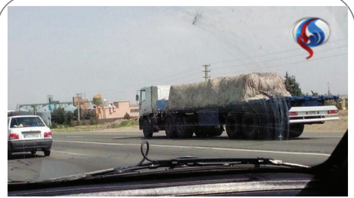
تصویر غیر رسمی درباره انتقال قطعات موشک اس سیصد به تهران