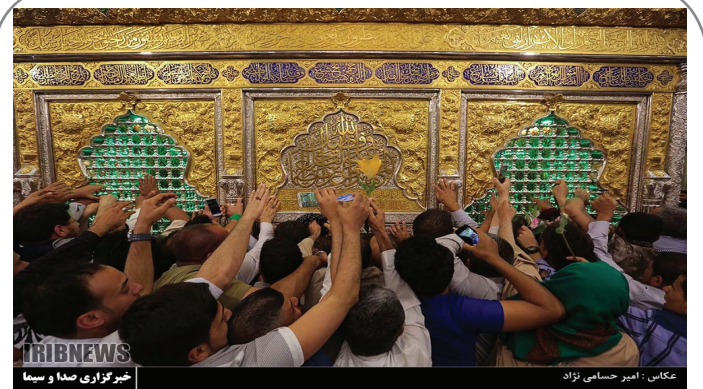
رونمایی از ضریح جدید حرم حضرت عباس(ع)