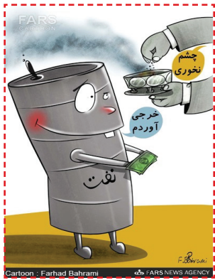
اسفند دود کردن برای نفت!