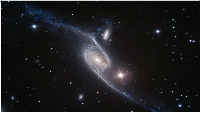
تصویر روز ناسا - کهکشانی به وسعت هفتصد هزار سال نوری!