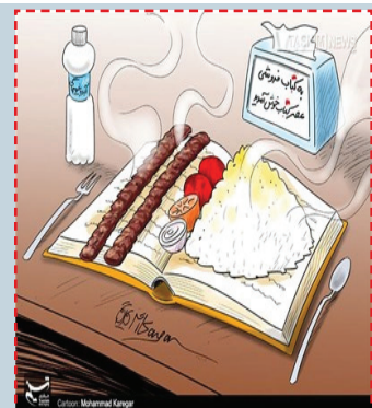
کتاب و کباب - ناشرانی که از «کتاب» به فروش «کباب» تغییر کاربری داده‌اند!