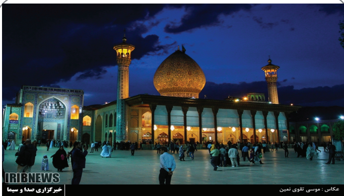
شیراز - سالروز شهادت احمد بن موسی (ع)