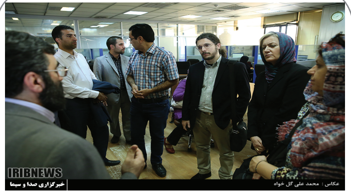
بازدید هیئت رسانه‌ای یونان از خبرگزاری صدا و سیما