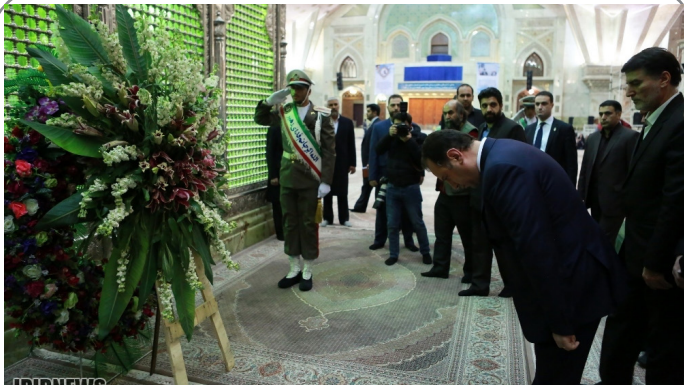
ادای احترام وزیر دفاع جمهوری ارمنستان در حرم امام خمینی