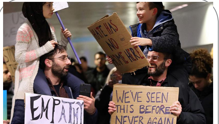
تراپ، مسلمانان و یهودیان را به هم نزدیک کرد!