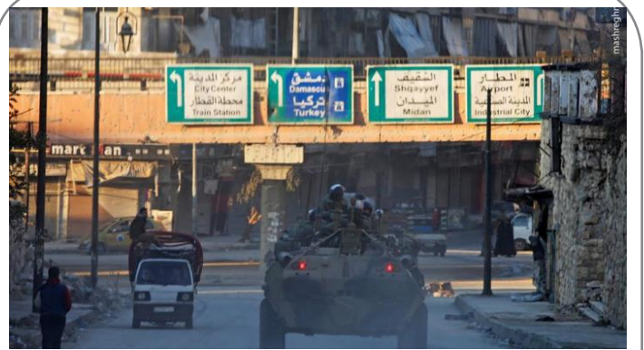
حضور نیروهای ارتش روسیه در حلب