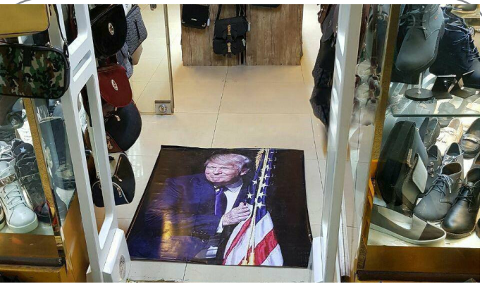
تراپ زیر پای مشتریان یک کفش فروشی در تهران