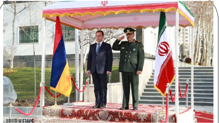
حضور وزیر دفاع جمهوری ارمنستان در ایران