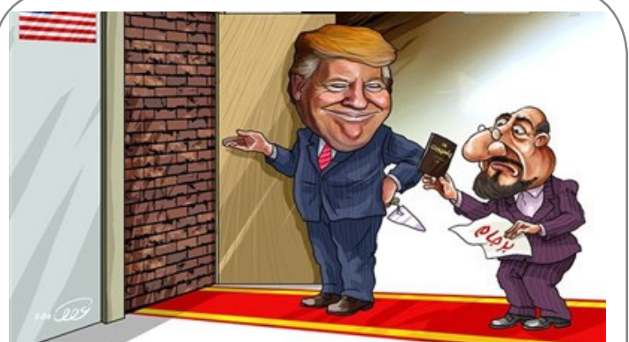
تصمیمات اخیر ترامپ!