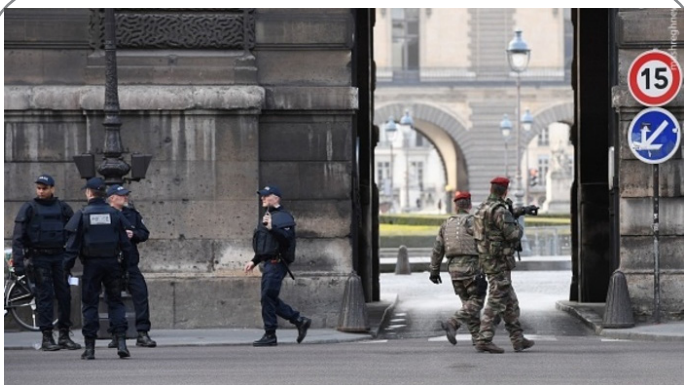
فضای امنیتی پاریس پس از تیراندازی در موزه لوور